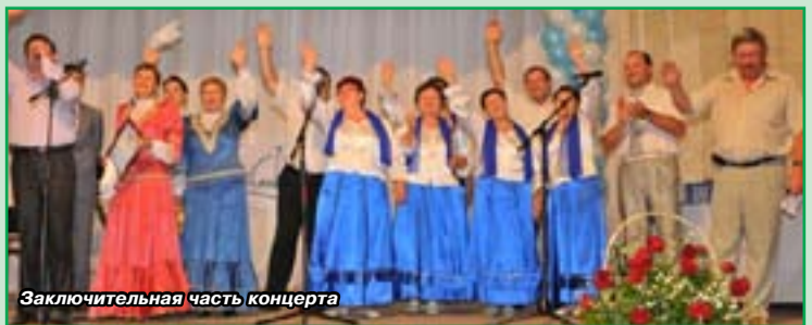
Заключительная часть концерта

Для участников торжественного собрания был дан праздничный концерт силами художественной самодеятельности Ростовского Водоканала.